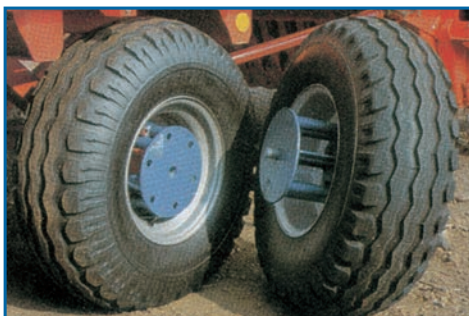
Anbauteile für Zwillingbereifung Gr. 10-15 bis 15-17, Felgen-Anschluss 161/205/6/0