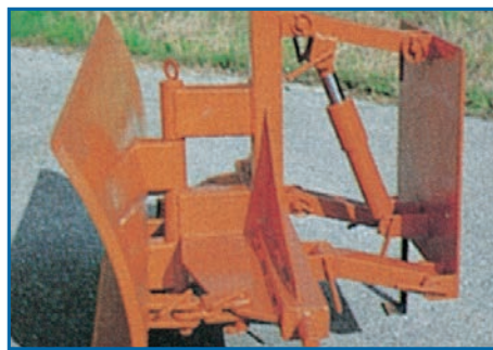
Frontanbaubock für HSK, mit Hubzylinder und hydr.-Schlauch

Für mehr Sicherheit im Straßenverkehr bieten wir außerdem ein Aufsatztuch, eine Fahne, Beleuchtung und Gummibereifung.